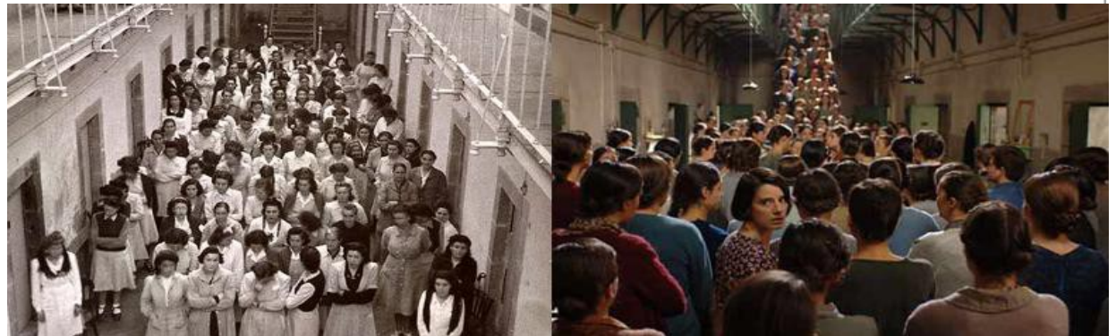
Las trece rosas Carlos Fonseca / Emilio Martínez